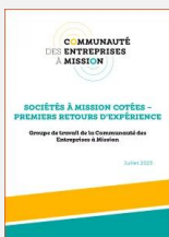
Sociétés à mission cotées