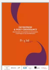
Entreprise et post-croissance