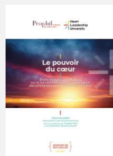
Le pouvoir du cœur